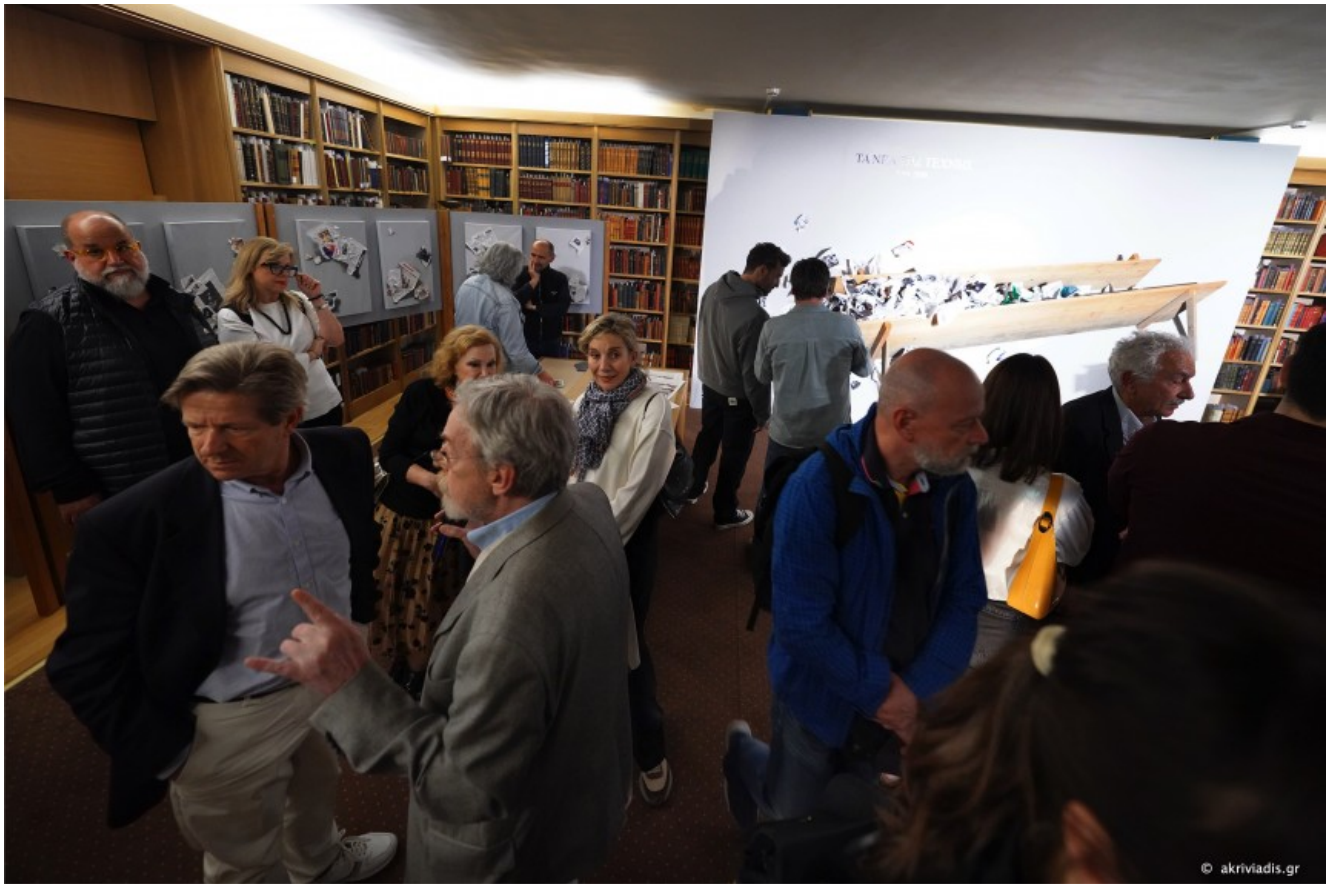
Άποψη του χώρου της έκθεσης