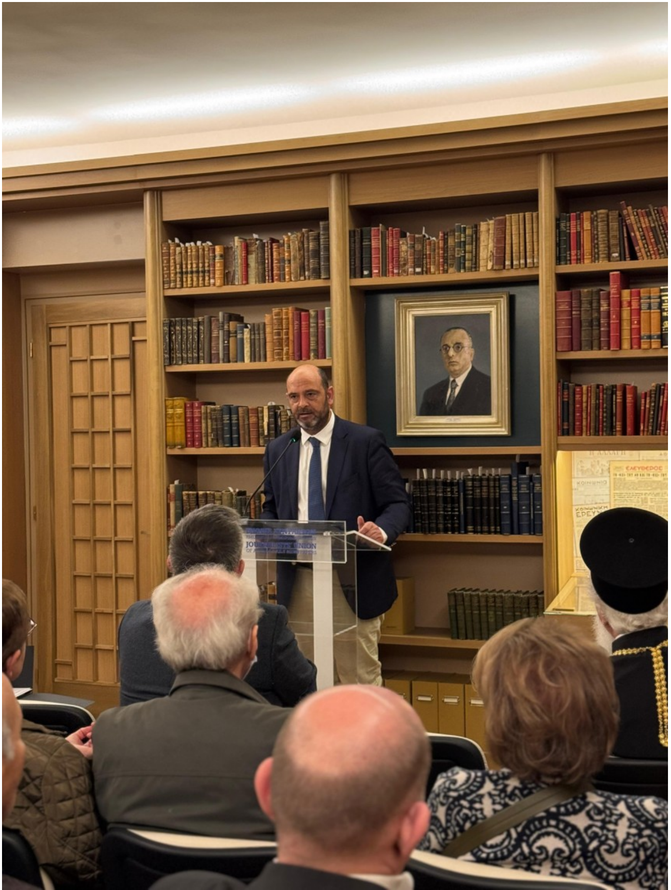
Ιάσων Φωτήλας, Υφυπουργός Πολιτισμού