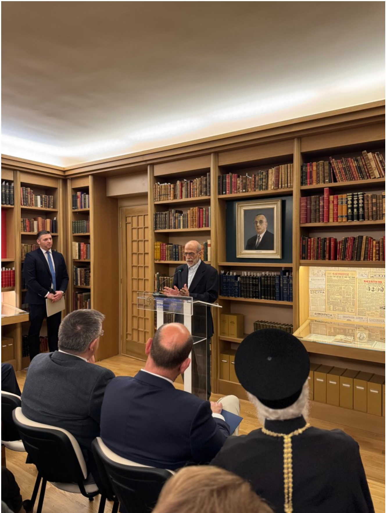
Μανόλης Κορρές, Αρχαιολόγος, Αρχιτέκτονας, Ομότιμος Καθ. ΕΜΠ,